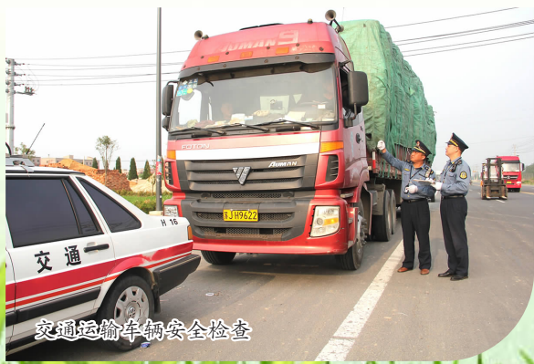
交通运输车辆安全检查