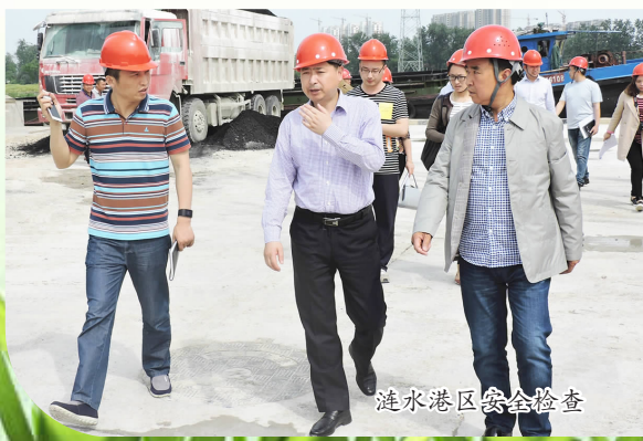
涟水港区安全检查