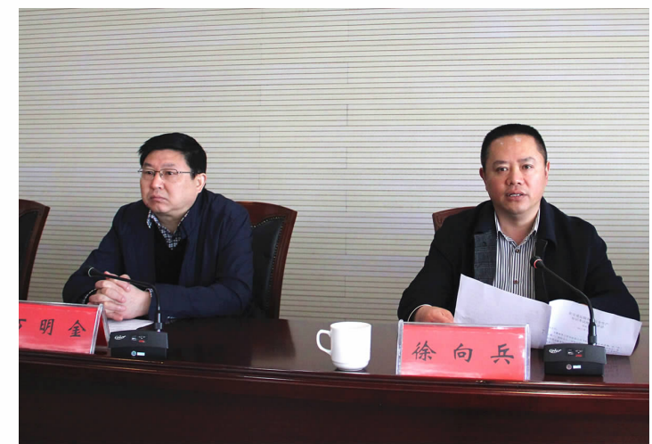
交通运输局领导进行春运动员