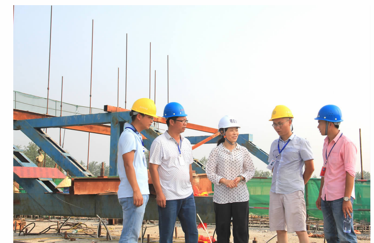
涟水港区安全检查