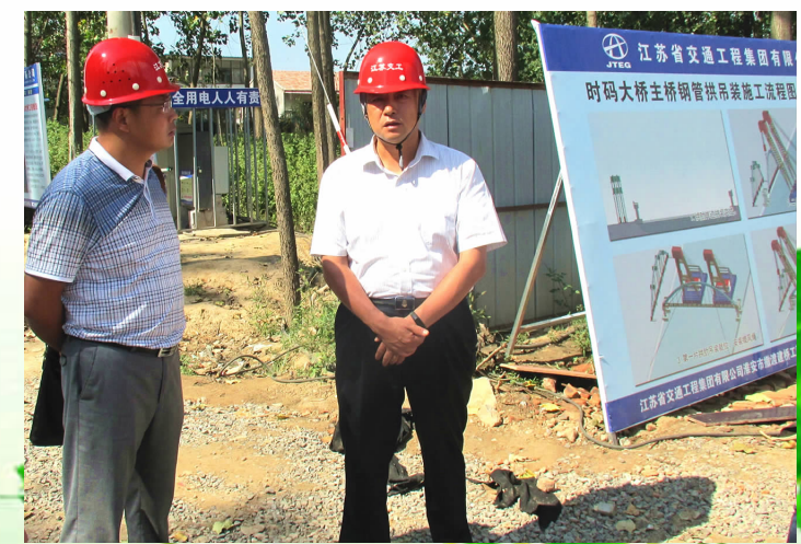
局领导在施工现场检查安全工作