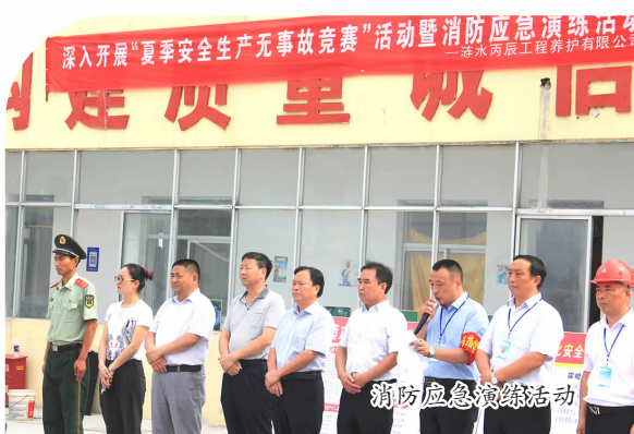
消防应急演练活动