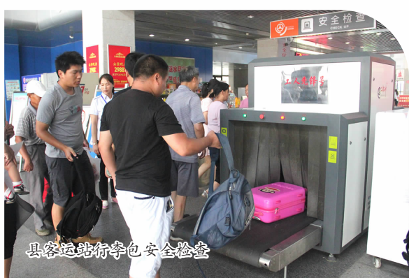
县客运站行李包安全检查