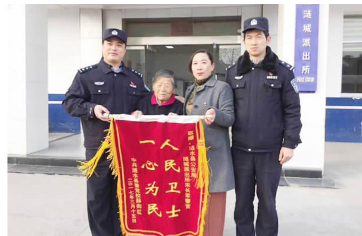
日前,县公安局涟水派出所民警接到市民报警称,一名80多岁的老人坐在东门社区一个僻静的小路旁。民警迅速出警,将老人收留后为老人买来吃的,因老人年事已高说不清家庭住址等信息,值班民警在警务平台上通过4个多小时的查找,终于将老人安全送回了家。因为老人及其家人为民警赠送锦旗表达谢意。