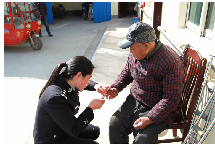
为进一步弘扬尊老敬老的传统美德,前不久,县公安局组织部分女警积极开展尊老敬老活动,她们深入城区的老年公寓,走近孤寡老人身边,为老人做一些力所能及的事。图为女警正在热心为老人剪指甲。