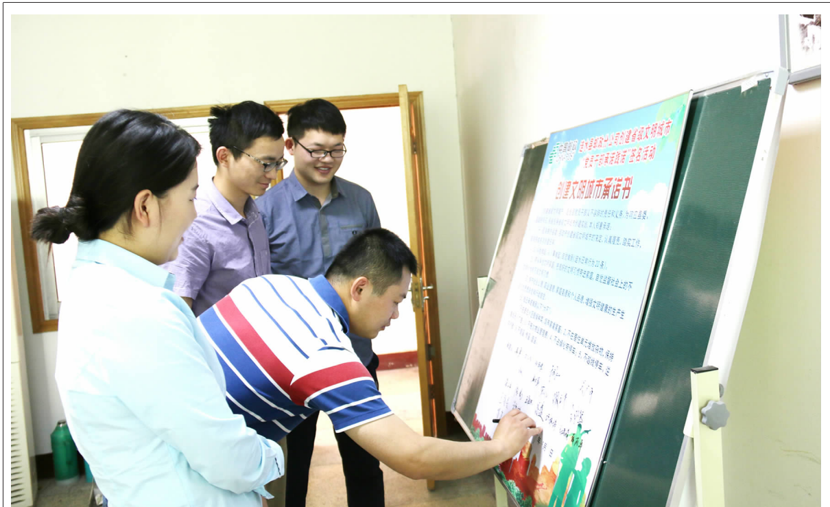
图片新闻 县邮政局党员干部响应县委县政府号召,积极投身省级文明城市创建活动,在单位创建省级文明城市推进会召开前,党员干部们在《创建文明城市承诺书》上签名,郑重承诺,要为涟水省级文明城市创建贡献自己的一份力量。