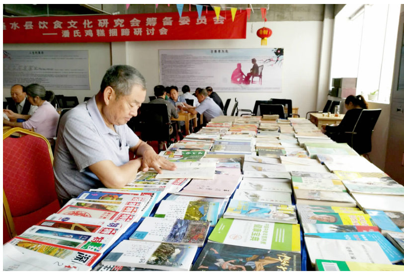
文化活动中心一角

越多,而请来的水电工因水管生锈而拧不开水阀。徐兆伦急了,他趴在地上,开始使劲拧起水阀来,半个多小时后,水阀终于被拧开了,而他的全身也湿透了。