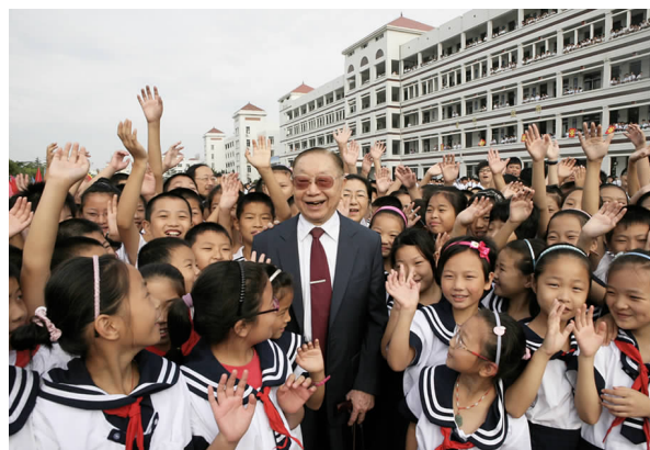
胸怀桑梓 情系青衿