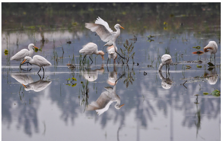
生态涟水 白鹭天堂