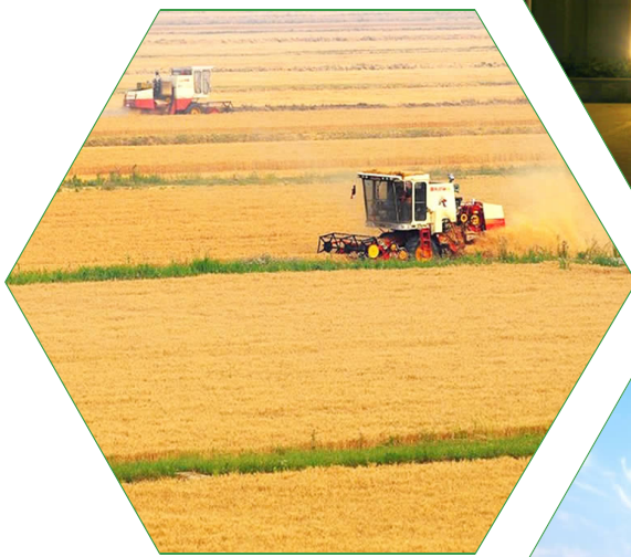
《黄河故道优质稻米基地》