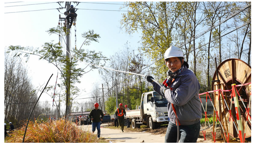
《农改前线的女工》纪佳成 摄