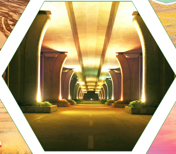
《多彩的肩膀》