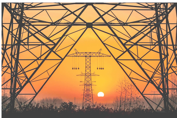
《迎接东升的阳光》