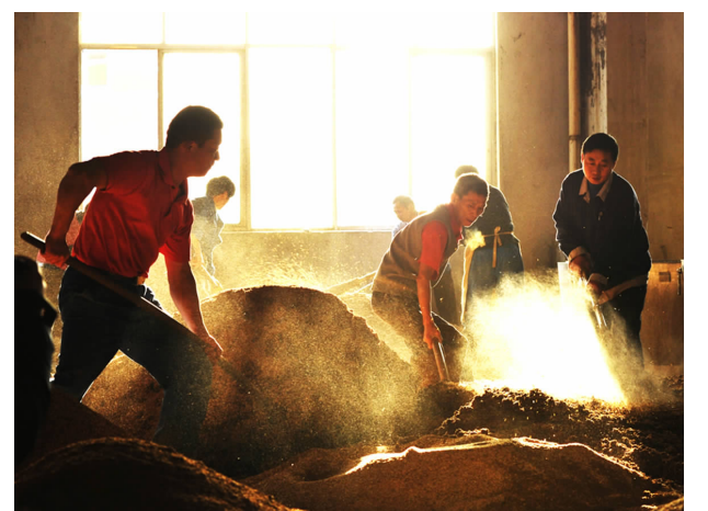
《繁忙的酒糟场》