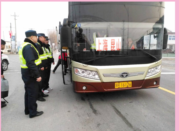
近日,县交通运输局运政稽查大队加大对车站、城区重点路段、机场周边的执法检查力度,严厉打击非法营运车辆,在路检路查中,加强对司机、乘客的交通运输安全宣传教育,发放春运安全宣传资料,督导司机自觉遵守交通规则,劝告乘客自觉抵制乘坐非法营运车辆。