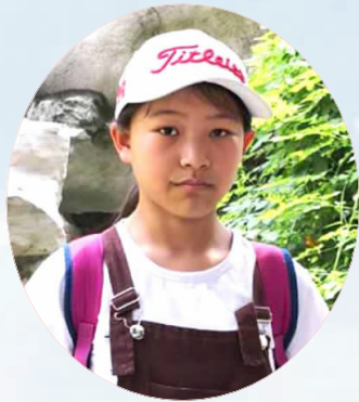
扯下一条柔软的柳枝,信手扬鞭,佯装轻松,踏上小路,却也快乐不起来,只觉得天空灰蒙蒙的,排水渠边是密密的、新生的