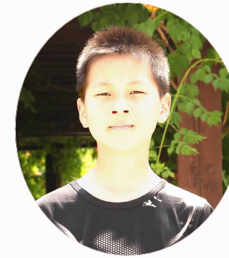
在我们涟水,正如火如荼地开展“两城同创”的活动。在这个活动中,我打算和爸爸一起去我们小区的空地公益扫地。

在一个艳阳高照的星期天下午,我和爸爸拿着扫帚和簸箕来到小区的那片空地上,准备大干一场。这片空地由于没有人管理,到处都堆满了各色的垃圾,走近便闻到一阵阵恶臭,都能冲上天了。