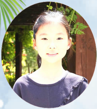
争当文明市民,要从我做起,从现在做起,从小事做起。在我身边就发生了这么一件

事:一天下午,我和一位好朋友正在玩耍,这时妈妈让我回去拿个东西,我的好朋友也要跟我去。回到家我给了她一瓶饮料。下楼她喝完后就随手丢了,我看见连忙说:“不能扔在地上,要扔在垃圾桶里。”她不好意思地说:“我下次一定注意!”我又说:“这是不文明现象,以后我们一定要注意。”