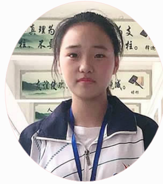
我们选择了自己的人生。积蓄了全身的力量,瞄准了明亮的方向前进。

马路上,经常会有人扔个垃圾袋,如“天女散花”。翠绿的草坪上,大大小小的脚印如“神来之笔”,让人不禁无奈叹息。现在,“低头族”重新出现,却不是看手机,而是弯下腰来,捡起垃圾,不知是身后的阳光装点着他们的身影,还是他们的笑容感染着阳光。卫生城市,我们继续加油。