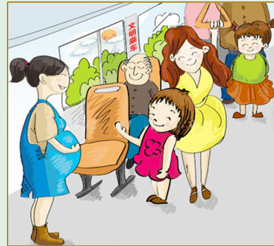
公交车上主动给需要的人让座