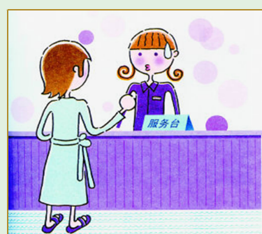
公共场合不穿拖鞋和睡衣