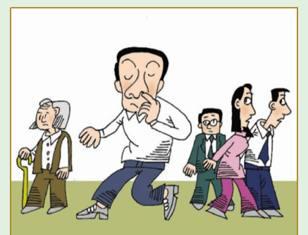
公共场合不抠鼻子和耳朵