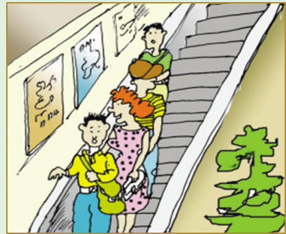
出入电梯间先下后上， 上下楼梯、手扶电梯靠右边