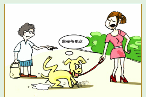
宠物要绳牵，便溺随时清