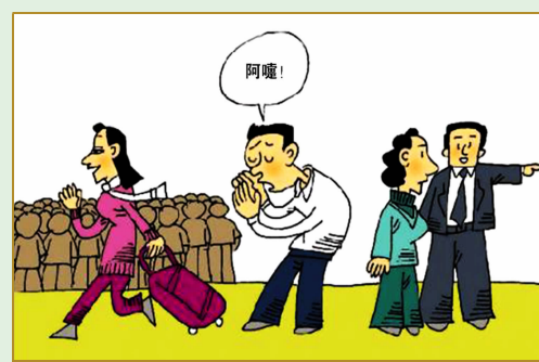
咳嗽、打喷嚏时用手遮挡