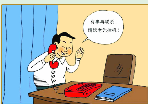
接听尊长电话应待对方先挂机