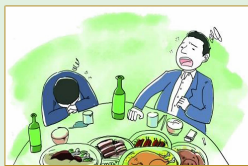
不浪费饭菜，不过分劝酒