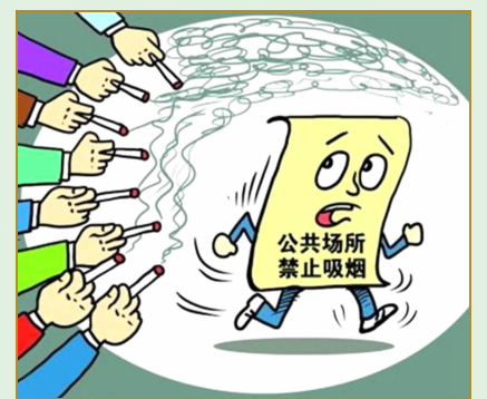
公共场所不吸烟、不随地吐痰