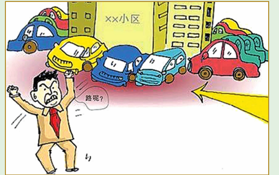
不乱停乱放、不坐非法营运车