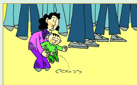
带儿童外出不随地便溺