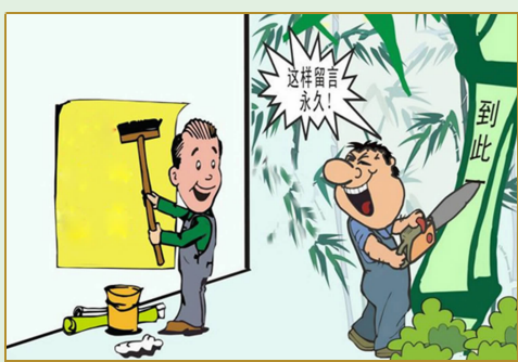
爱护公共设施，不乱刻乱画