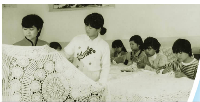
▲曾风靡一时的手工针织桌布 县文化馆 供稿