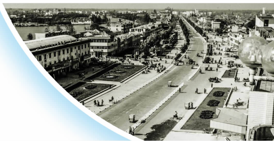
▲涟水老城区旧影