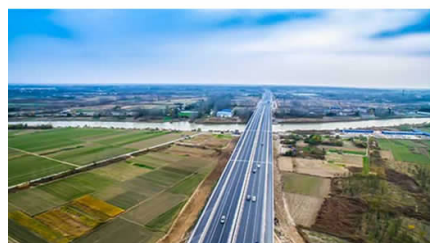
▲盐河涟水路大桥