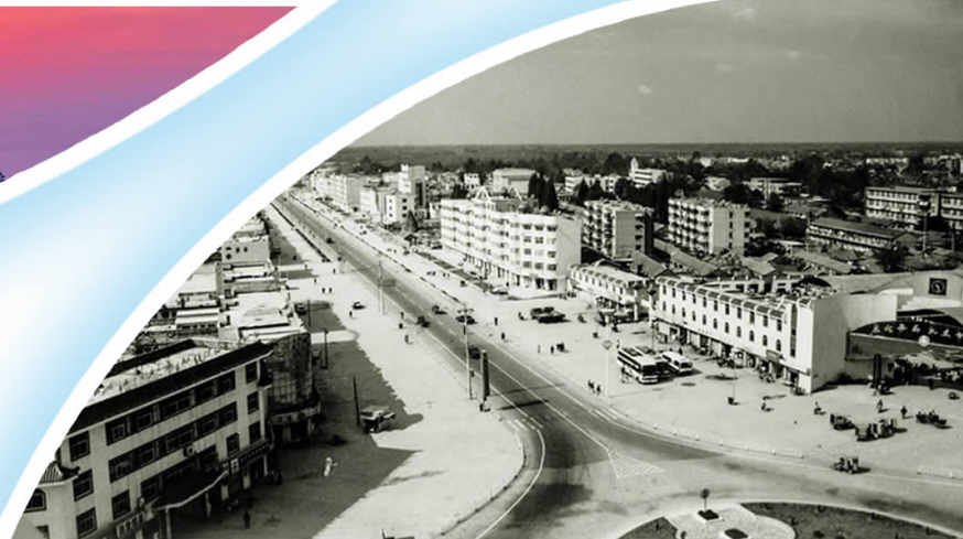
▲20世纪80年代老城南