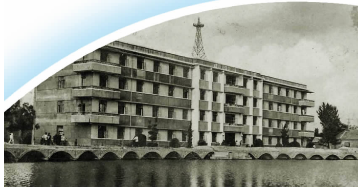
▲原县政府办公大楼