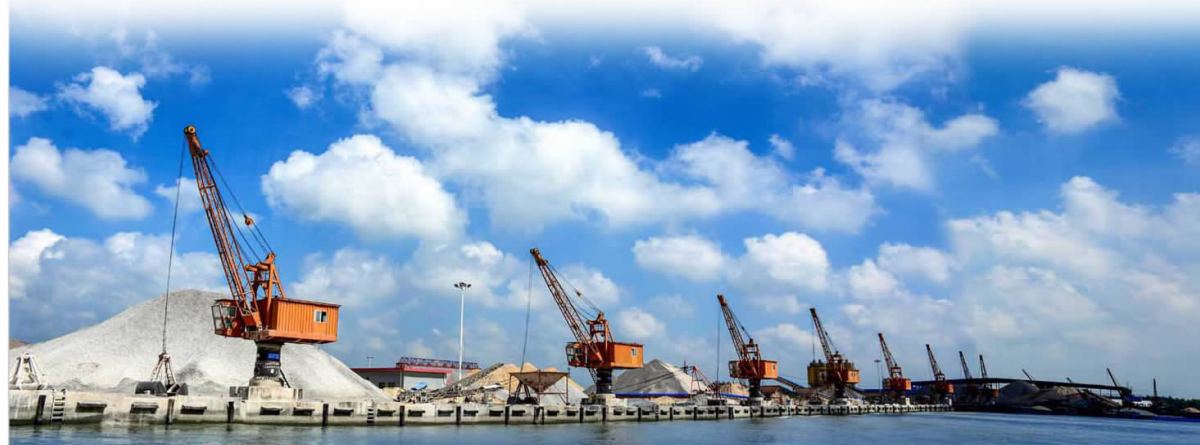
▲碧水蓝天盐河美