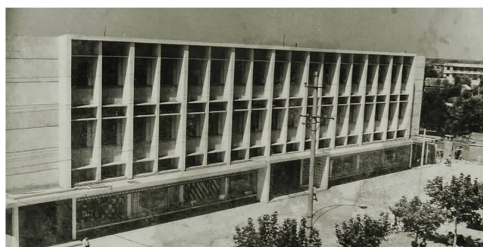
▲20世纪80年代县百货大楼