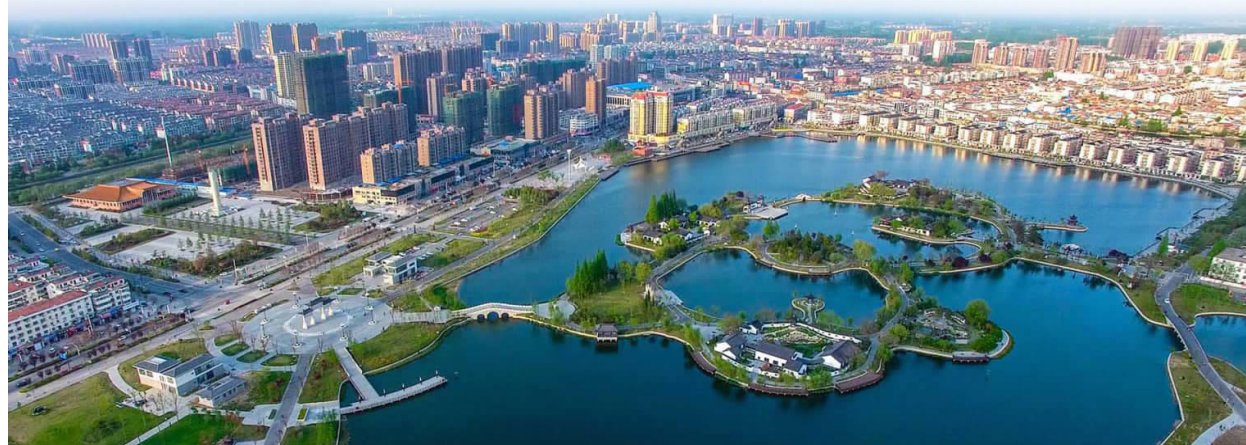
▲城水相依

——我县“不忘初心、再创辉煌”庆祝新中国成立70周年摄影图片展之美丽家园篇(下)