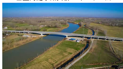
▲盐河蔡工大桥