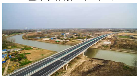
▲盐河王二庄大桥