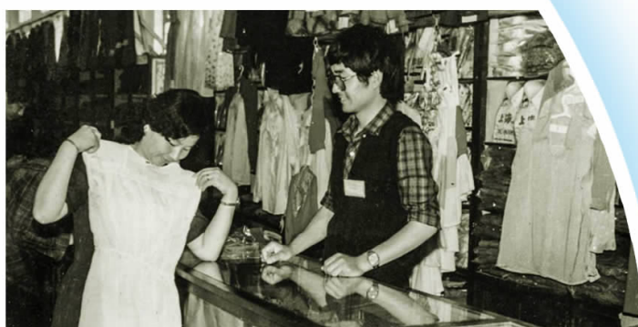
▲20世纪80年代群众在县百货商场挑选服装