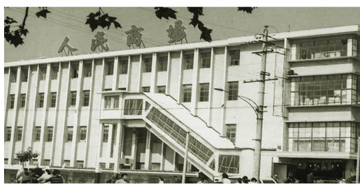
▲20世纪80年代县人民商场