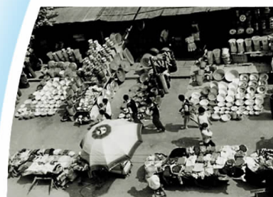
▲20世纪80年代我县乡镇集市 孙爱华 摄