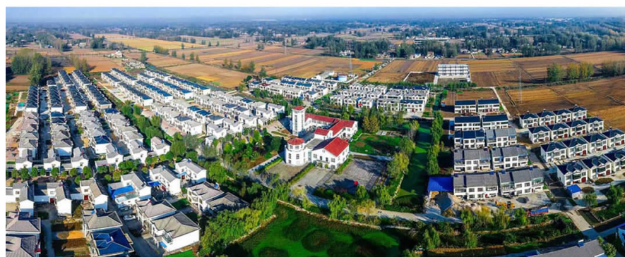
▲康居住园——夜台村