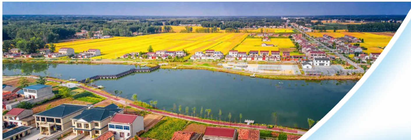
▲扁担河畔稻花香