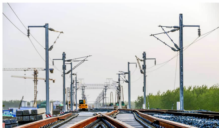
▲高铁修到我家乡