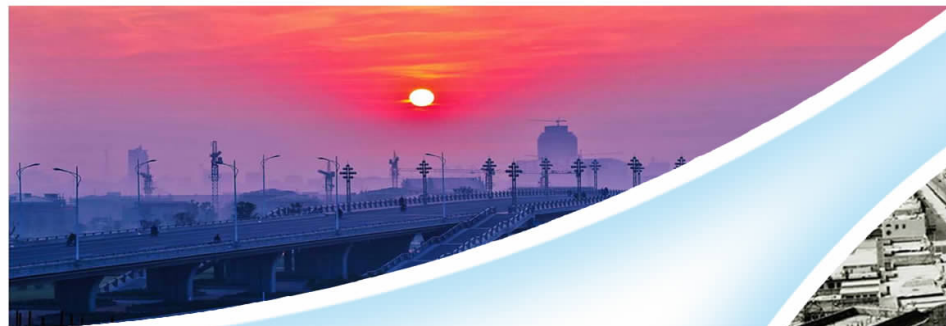
▲红日大桥