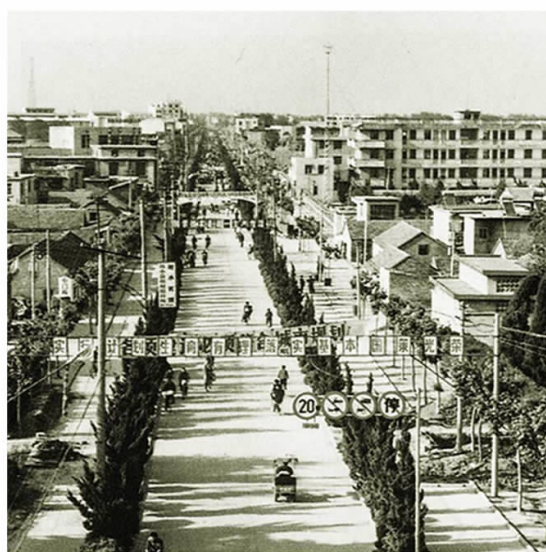
▲20世纪90年代古淮河上浮桥 ▲20世纪80年代安东南路街景