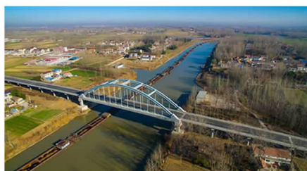
▲盐河时码大桥 许军 摄