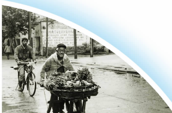
▲雨后推独轮车卖菜的老人行走在中山路上