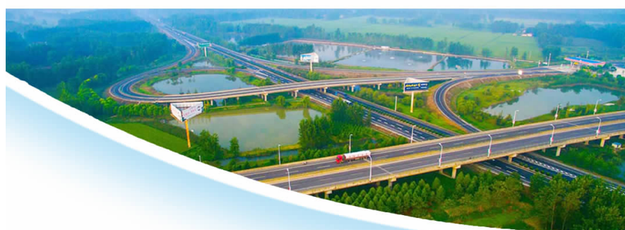
▲鲲鹏极目大交通