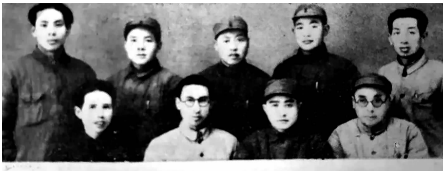
图为朱士俊《抗日斗争片断》书中图片

1946年11月，中共华中分局决定建立中共淮北盐场特区委员会，对我党控制的盐场区域内党、政、军、群组织和盐业的产、运、销及盐税稽征等实行党的一元化领导，隶属于中共华中分局直管。盐特委下设堆沟、陈家港、灌东、新滩、船舶5个区及10个乡镇的党政机构，所辖盐场共有9个党支部、150余名党员。下辖5个连建制的盐警大队。在血与火的战争年代，中共淮北盐场特区委员会不但是我党在淮盐产地政治工作的领导者、革命战争的指挥者、两淮盐区人民生产生活的保护者，还担负着淮盐生产的管理和所产淮盐的销售及盐税稽征等多项任务，所征得的盐税用于支援人民解放战争。