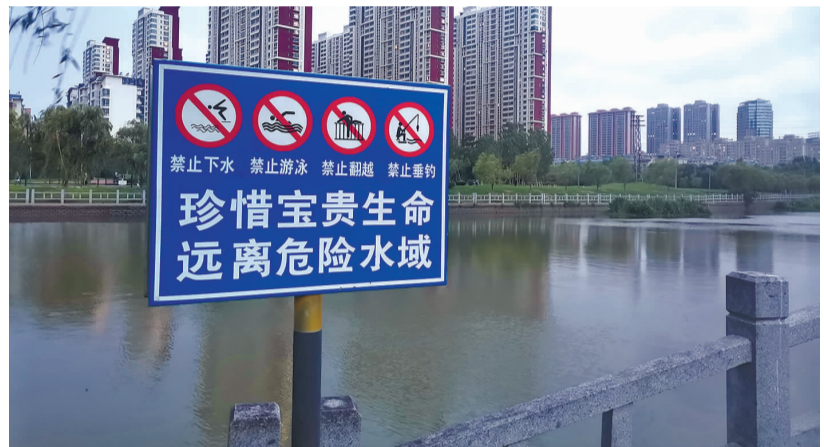
东盐河景观河道边的警示牌