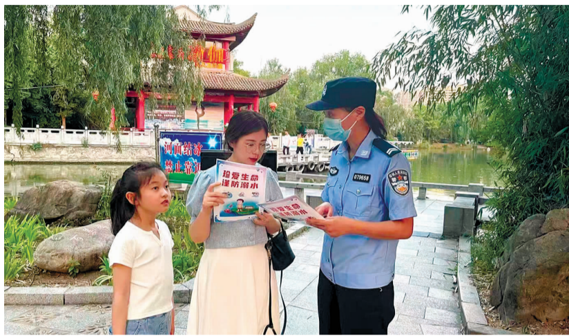
民警在公园水塘边开展暑期儿童防溺水宣传