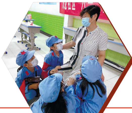
▲近日,连云区海州湾街道营山社区开展“老兵讲故事 薪火永相传”主题活动,邀请老兵为青少年讲述军功背后的故事,厚植爱国情怀,树立保家卫国理想。图为社区居民为老兵戴上光荣红花。