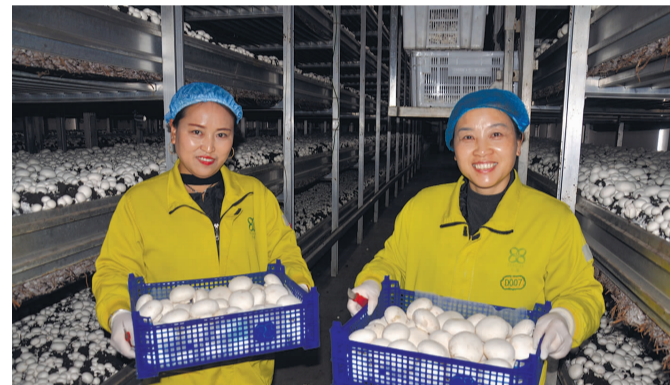
11月7日,江苏裕灌现代农业科技有限公司员工正在采收双孢菇供应市场。据介绍,灌南县现有食用菌工厂化生产企业43家,全年双孢菇、杏鲍菇、草菇、金针菇等各类蘑菇总产量达50余万吨,同时吸纳1.6万留守妇女就近就业,人均年工资超4万元,“小小蘑菇”已成为灌南富民增收大产业。(沈海霞)