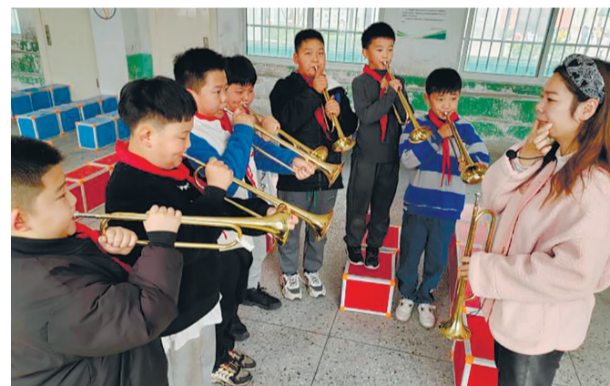
11月14日上午,灌南县长茂小学老师指导小学生练习小号。近年来,该校大力推进教育改革与创新,积极探索“一校一品”多元发展的特色学校创建之路,鼓励各班级利用大课间、课外活动等将太极拳、二胡、乒乓球等项目引入校园,既丰富了校园文化生活,也提高了学生的综合素质。(唐伟伦)