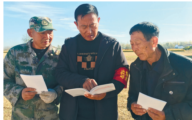
连日来,灌南县李集镇组织人大代表深入田间地头,与群众面对面沟通交流,向种植大户宣传禁烧政策及法律后果,提高群众法律意识和生态环保意识;学习贯彻党的二十大精神,将“两山”理论传达到群众中去,为建设秀美宜居李集镇贡献人大力量。(左星星)

进来”,推动项目进程;内外兼修,扶持现有企业做大做强;强化服务,推动项目顺利落地生根。“在冲刺全年目标的关键时刻,我们将继续加大为企业服务工作力度,帮助企业协调生产要素,对照全年目标任务排差距、找不足,确保全面完成全年目标任务。”灌南县经济开发区相关工作人员表示。 如今,灌南县上下正把党的二十大精神学习成果转化为奋进新征程的生动实践,以更饱满的热情、更务实的作风、更昂扬的状态,冲刺全年目标任务,不断推动经济社会发展再上新台阶。 (夏丹华)