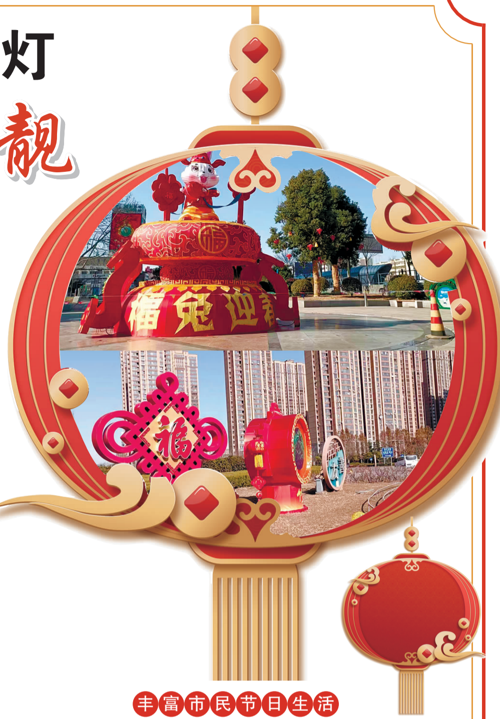
丰富市民节日生活

河木栈道两侧的树上用数百串满天星缠绕树枝,并用数百只动态蝴蝶结彩灯球点缀;龙河广场绿化带内安装一套“中国梦”造型大型灯组,同时铺设灯带100米、安装元秋光透灯100个、满天星60串,并将安装福兔灯66个和投光灯84套以及洗墙灯95套。 在郁海广场转盘南侧,“欢迎回家”字样的彩灯格外亮眼,让刚刚返回港城的游子倍感温馨,转盘四周还分别安装了高雅大气的“梅、兰、竹、菊”造型的彩灯。与此同时,市区各大公园喜庆灯饰也陆续点亮。其中苍梧绿园通过夜景亮化,为市民营造出别样的游园氛围,烘托出了浓浓的欢乐中国年气息,其北门和西门分别安装了灯笼500只,北门至中心广场安装灯带600米、东门安装灯带1100米,并设置了喷泉造型灯一组、礼花灯一组和“欢度春节”雕塑小品2组。海州公园、新浦公园、瀛洲公园主入口则安装生肖造型气模,配合灯光亮化提升节日气氛;其中新浦公园动物园门口及动物园中心小广场安装生肖造型雕塑和座椅,景观区域还结合公园内智慧路灯安装了满天星、灯带及灯笼若干。城区盐河路、朝阳路、海连路等主要城市道路中国结造型的彩灯悉数亮相,玉带河、东、西盐河及龙尾河等城市河道轮廓灯也营造出了水美夜景。