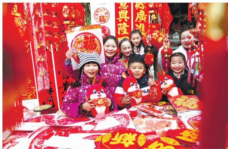
昨天,在海州区民主路老街,市民们在挑选大红的中国结、精巧的福袋、活灵活现的兔子贴画。春节将至,年货市场日渐红火,街头巷尾处处洋溢着节日的气息。记者 樊晓妹 张晓敏 摄影报道

春节期间,海州商业街除了开展精彩的文旅商活动,还将开展春节氛围营造活动,用璀璨光影和传统花灯盛装扮靓街区。夜幕降临,华灯初上,走进盐河巷,青砖黛瓦间大红灯笼高高悬挂,树梢枝缝中五颜六色的彩灯闪耀,还有巨型兔、国潮京剧人物群等主题花灯,给节日的古巷带来别样的趣味。在民主路老街,成群的璀璨天幕、成片的灯笼天幕、成串的大红灯笼,搭配花灯长廊、玫瑰隧道,营造出了火树银花、流光溢彩的梦幻色彩。毗邻的陇海步行街以中国红为主要色调,在东、中、西街设置兔年吉祥鸿运门廊、百米灯笼走廊和年货大集门廊,并在路灯杆上悬挂中国结。夜幕下,红光映人,结影成双。