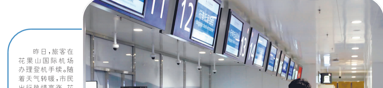
昨日，旅客在花果山国际机场办理登机手续。随着天气转暖，市民出行热情高涨，花果山国际机场航班量大幅增加，每天进出旅客约三四千人，春运以来客流量超11万人次。

春风送暖，暖在就业服务。实施人社专员联系企业制度，对有招工意愿的企业，“一对一”上门提供招聘服务；“点对点”推送社保缓缴、稳岗返还、苏岗贷等政策礼包，帮助企业纾困发展；启动建设“家门口”就业服务站15个，针对失业青年等重点群体开展“一人一策”援助活动……打出就业“组合拳”，打通就业“肠梗阻”，方能稳住全市就业大局。（下转二版）