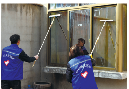
日前,市自来水公司“小白鸽志愿者”服务队来到结对帮扶单位东海县驼峰乡麦南村,为该村3户家庭困难农民打扫卫生、整理环境。