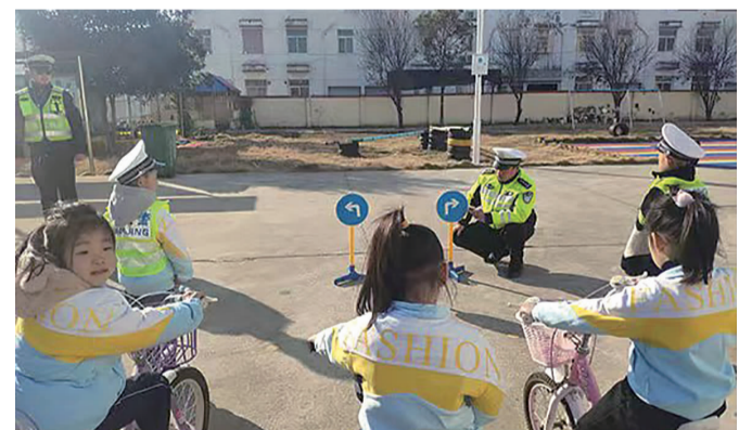
日前,东海县白塔交警中队民警走进辖区学校给孩子们上了一堂生动、立体的交通安全知识课,鼓励学生争做文明交通的倡导者。 (顾国强)

学校要求学生在古诗词中找出情景,到附近的大自然中寻找真实景物;也可到大自然中发现景物,到古诗词中寻找相关联的诗词佳句;还可踏青游玩,模仿古人吟诗作赋。在老师的带领下各年级依次出发,一路上学生欢声笑语,喜悦之情溢于言表。