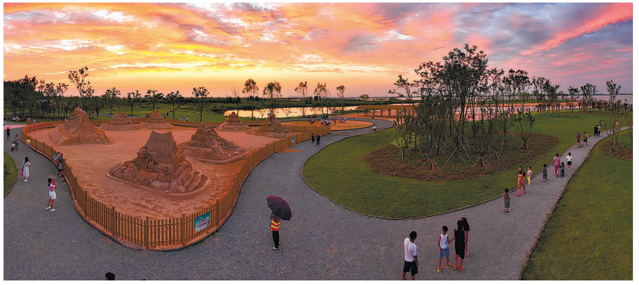
▼ 7月16日,我市多地出现火烧云美景。在石梁河库区黄金沙滩景点,晚霞、沙雕、小岛构成了一幅美轮美奂的画面。