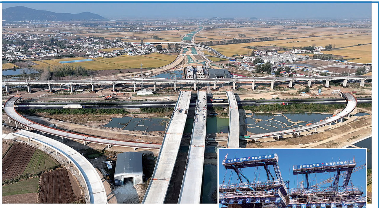
近日,在连(云港)宿(迁)高速公路灌云县下车段,工人们在抢抓晴好天气进行施工。连宿高速公路是我省重点交通工程项目,也是省“十五射六纵十横”高速公路网规划中“横三线”的重要组成部分。