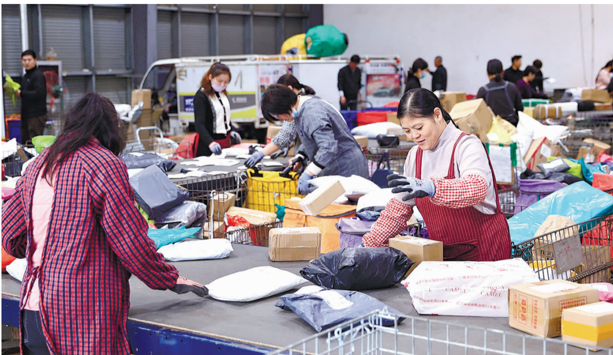
昨日,在赣榆高新区电商快递物流园内的一家快递企业,工作人员在分拣车间忙碌。临近“双十一”,生产企业开足马力、备足货源,物流企业腾仓扩容、增强运力,迎接“双十一”购物高峰。

今年9月7日,2024年苏新消费·绿色节能家电促消费以旧换新专项活动开启,持续至12月31日,以财政补贴推动家电、电脑等24大类电器商品的绿色消费。得益于此次补贴活动,我市家电市场迎来了一波销售高峰。“双十一”期间我市一些商场将