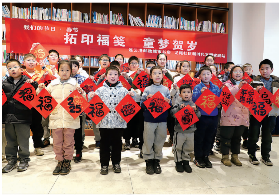
▲近日,海州区新东街道龙尾社区精心组织了一场别开生面的“拓印福笺 童梦贺岁”活动,大学生志愿者们带着传统文化走进社区,为孩子们假期生活增添了一抹绚丽色彩。记者 王进文 通讯员 陈怡璇 唐梦玲 摄影报道