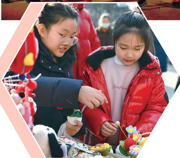
▲近日,海州区玉河社区举行“灵蛇贺岁 福满玉河”春节惠民活动,活动现场设置“巳巳如意”幸运红包墙,现场开展写春联、拓印、套圈等传统文化活动,居民们其乐融融迎接春节。