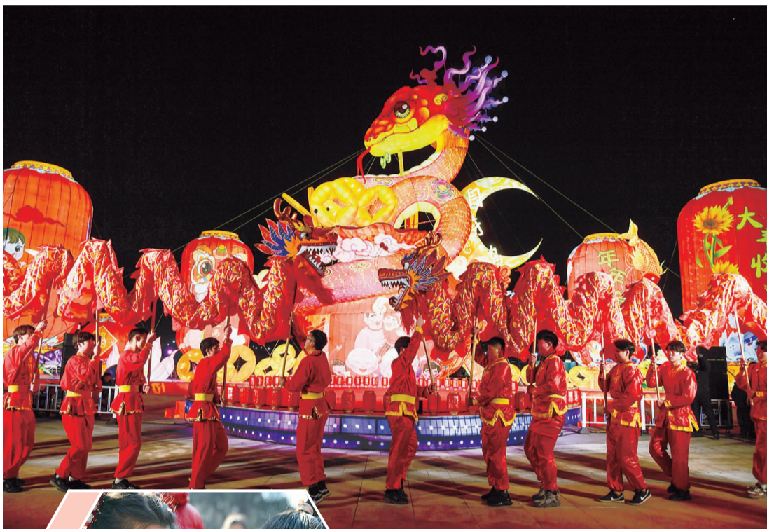
▲近日,“寻光之旅,童梦奇遇”2025第三个月牙岛新春灯会上灯仪式在樱月广场举办,流光溢彩的花灯盛会正式拉开帷幕。

灌南新华书店还与多家出版社合作,大力宣传本次活动意义;活动最后,根据灌南县委宣传部的统一部署,灌南新华书店对张店镇进行了点对点的资金捐赠,以帮扶当地乡村的全民阅读和文化建设。作为国有文化企业,灌南新华书店承载着传播知识、推广阅读的重要使命。未来,该书店将继续深化书籍捐赠与阅读推广工作,为乡村文化建设贡献更大力量。(周倩)