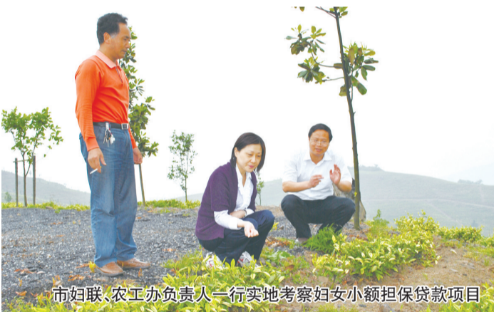
市妇联、农工办负责人一行实地考察妇女小额担保贷款项目

全市妇女小额担保贷款推进会召开后,市妇联积极协调相关部门,扎实稳步推进全市妇女小额担保贴息贷款工作,竭尽全力帮助更多的创业女性解决资金困难。截止7月底,全市已发放妇女创业小额贷款470万元,妇女创业小额贷款发放工作取得阶段性成果。下阶段,在继续做好妇女小额担保贷款工作,完成既定目标的基础上,市妇联还将进一步加强对贷款户的跟踪联系,了解她们的经营情况、贷款用途去向,发现问题及时纠正,发现困难尽力协调,努力做好服务指导,使创业女性的创业之路更加通畅,培树起一批新的巾帼创业典型。