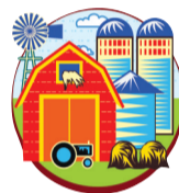
统筹城乡发展 构建和谐溧阳

在科技下乡和产品进城的过程中,溧阳市水跃渔业专业合作社成功架起了城乡对接的桥梁。下一步,合作社将以水产养殖为核心,食品加工为龙头,大力发展生态观光、休闲度假、垂钓娱乐等特色休闲渔业,积极探索和实践“基地+公司+农户”的现代农业一体化发展之路。