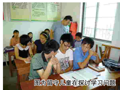
图为留守儿童在探讨学习问题