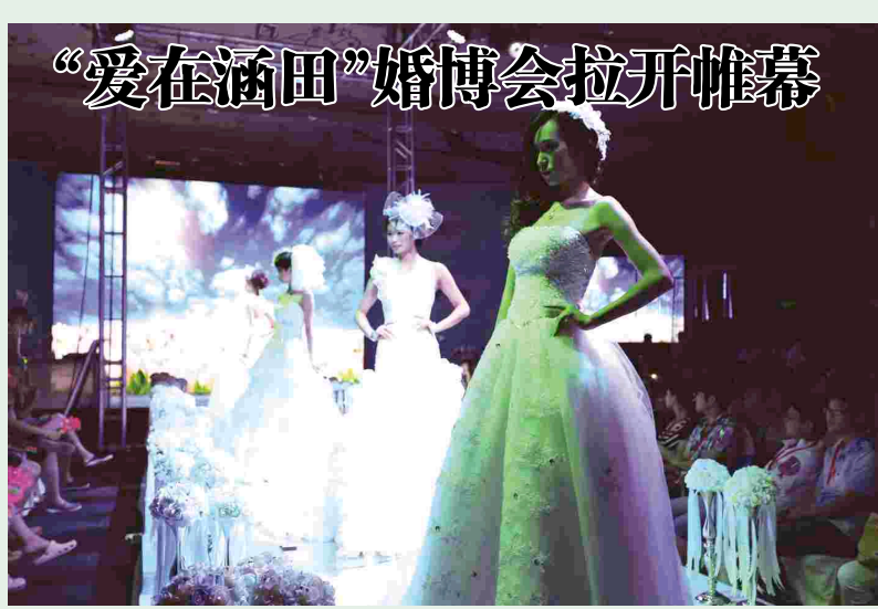
(杨欧群) 8月25日,由溧田度假村发起主办的“爱在溧田”首届婚博会拉开帷幕。本次婚博会汇集了众多国内外“婚事消费品牌”,旨在为新人提供更轻松、更周到的“一条龙”婚庆服务。