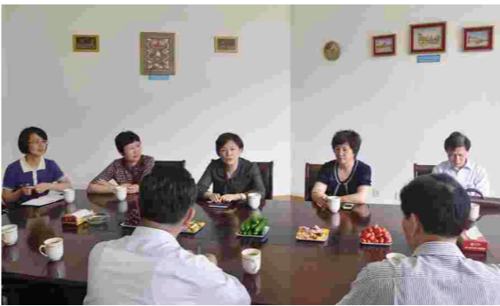
拔为正科职领导干部。

按照“抓住源头,打好基础,完善机制,推进选拔”的总体要求,加大了我市党外代表人士队伍建设力度。组织举办了各类党外代表人士参加的培训班,有300多人次参加培训。完善党外干部培养选拔工作机制,党外干部政治安排和实职安排工作取得新发展。推荐认定了41名党外后备干部,更新了后备干部数据库。在市委的关心下,有4名党外干部得到提拔,其中2名提