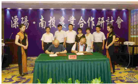
科技和送文化下乡活动。民建还募集资金6万余元,成立“溧阳市民建思源基金”。

积极开展对民主党派和无党派人士的思想教育和政治引导,分类分期举办了多期讲座,组织200多位统一战线成员认真学习贯彻党的十八大和十八届三中全会精神。贯彻落实中央文件精神,制定了一系列文件,推动多党合作和政治协商的制度化、规范化和程序化建设。协助市委召开各类座谈会,情况通报会,促进了党委和政府决策的科学化、民主化。组织民主党派和无党派人士围绕市委、市政府中心工作参政议政、建言献策。形成了120多件人大建议和政协提案,以及20多件社情民意,有17件社情民意得到市委、政府领导的批示。帮助民盟基层委员会、民建支部和无党派代表人士联谊会分别确定“同心聚智惠民”、“同心思源工程”和“同心和谐之韵”三个服务品牌,开展送医、送教、送