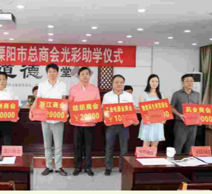
和会员企业致力于爱心助学、助困活动,慈善爱心捐款达300多万元。此外,商会会员企业还积极参加雅安抗震救灾活动,全市民营企业共向灾区捐款捐物50多万元。

光彩事业有成效。通过光彩事业促进会的平台作用,鼓励会员企业实施定向捐助,截止11月底,全年通过光彩事业促进会定向支持新农村建设资金投资达527.6万元。组织商会组织