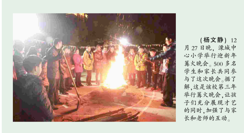
(杨文静) 12月27日晚,溧城中心小学举行迎新年篝火晚会。500多名学生和家长们共同参与了这次晚会。据了解,这是该校第三年举行篝火晚会,让孩子们充分展现才艺的同时,加强了与家长和老师的互动。