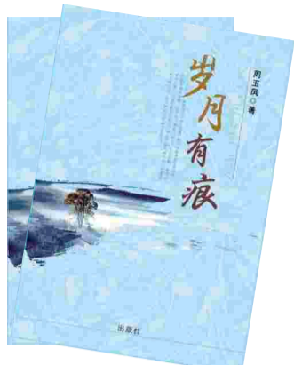
《岁月有痕》,周玉凤著,中国戏剧出版社 2013年 12月出版

读书时,每次听语文老师讲解作者简介时,我都特别羡慕和崇拜那些作者,当时想,能用文字表达并引起很多读者的共鸣,是一件多么了不起的事情啊!而对我这样一个理科较好,语文每次只能勉强及格,到高中毕业都不曾学过汉语拼音的人来说,自然不敢做今后还会在报刊上留下点滴墨迹的梦。