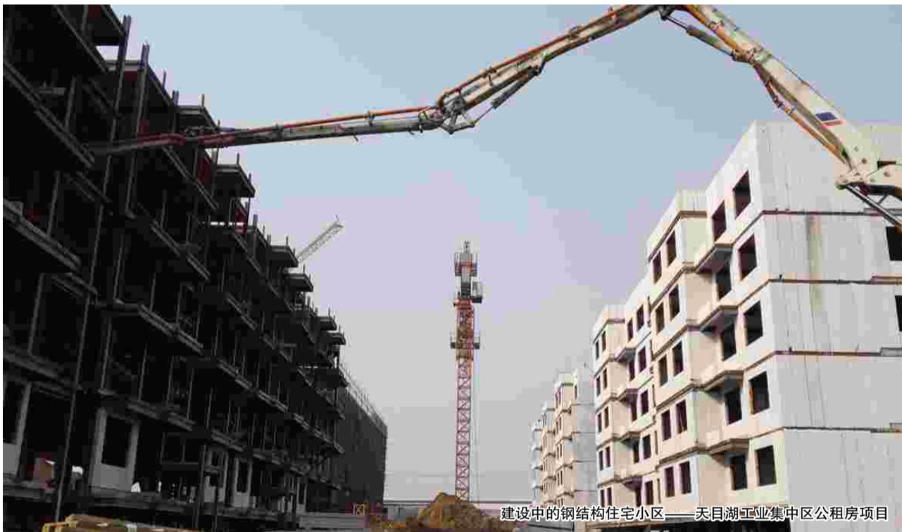
建设中的钢结构住宅小区——天目湖工业集中区公租房项目