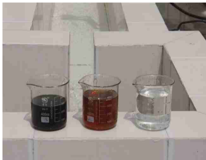
(陈蕾 黄姣) 昨日,记者从市城管局获悉,我市生活垃圾卫生填埋场垃圾渗滤液处理系统改扩建项目顺利通过