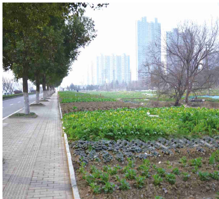
罗庄路一侧路边被种满了蔬菜和农作物

(邹迪) 近日,记者在罗庄路附近发现,曾常年被废水浸泡的池塘、日日承受汽车尾气的路边,不少市民“见缝插针”地种植了蔬菜和农作物,将闲置的土地变成自家的“菜园子”。据了解,这种情况在我市已不罕见。然而,这样的环境下种植出的蔬菜真的“令人放心”吗?