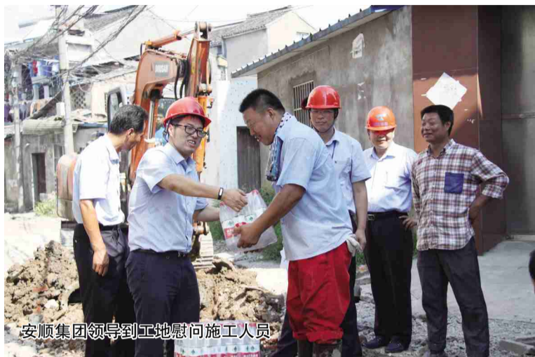
安顺集团领导到工地慰问施工人员

(董扣新) 赤日炎炎,为让城中村居民早日用上天然气,安顺集团天然气安装工程队顶高温、冒酷暑,奋战在城中村天然气安装工程一线。