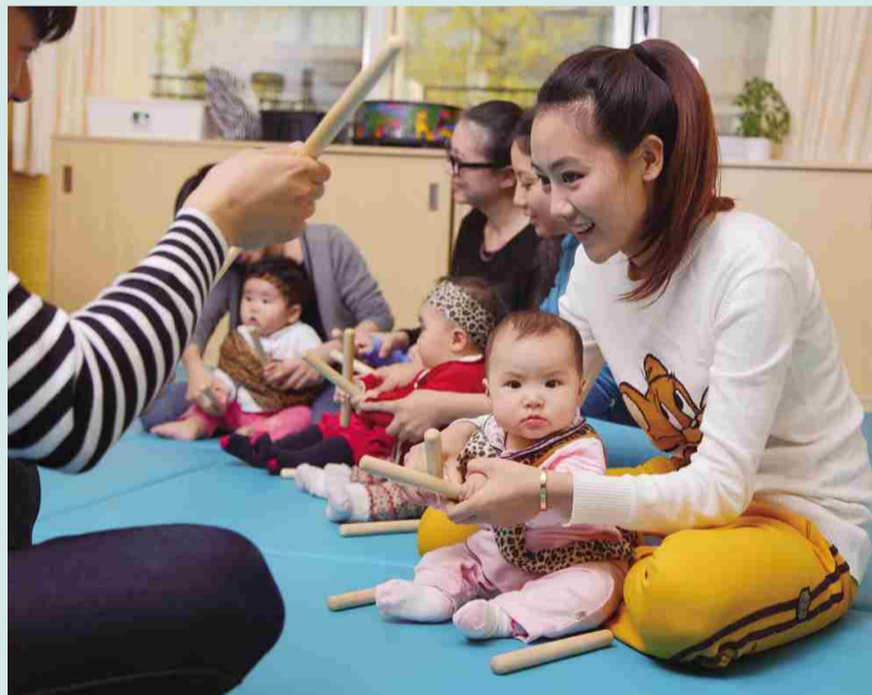
宝宝在家长的陪同下上早教

(陈雅) 8月17日下午,记者来到我市一家早教中心,室内装饰生动活泼,富有童趣,玩具器材都整齐排放着。家长带着不满周岁的宝宝围着老师坐着,按照老师的指令指引宝宝完成爬行、认卡片等任务。看起来,年龄较大的宝宝更容易融入“学习”,较小的宝宝则显得有些有些不配合。