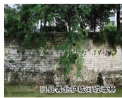
旧县路北护城河城堞基