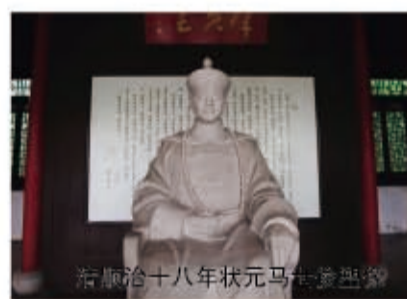
清顺治十八年状元马世俊塑像

局周正,井然有序,环境典雅。到嘉庆十八年(公元1813年),有大成殿三大开间,雕梁画栋,重檐歇山顶,正中供奉孔子像。大成殿前,依序有戟门三间,棂星门与石阙一座。大成殿后是明伦堂即教室,五大开间,单檐硬山顶。明伦堂后是尊经阁,五大开间,上下二层,重檐歇山顶,是贮藏朝廷颁发的儒家经典的藏书楼或阅览室。尊经阁左边是县教谕的办公用房,右边是县训导的办公用房。教谕、训导,都是朝廷命官。教谕,主管县教育,正八品,主持县试,负责选拔录取生员兼为县学生员讲经书。训导,从八品,协助教谕,重点负责县学生员的德行教育。尊经阁后是一排排学生食宿等用房。大成殿棂星门南面有一块广场,广场前是泮河,泮河对岸有一堵斗形照壁,照壁两侧有“文官下轿,武官下马”字样的石刻,照壁背临南城牆,城牆上有一排突出的石块,石块上有圆圆的孔洞,用来插旗帜,也可系马缰。早年,文官坐轿从学宫东边过文德桥到照壁背面前下轿,武官骑马从学宫西边过武功桥到照壁背面前下马,然后无论是气宇轩昂的文官抑或孔武刚硬的武将,皆低眉顺眼弯腰款步回走,屏声敛息进入大成殿拜谒圣人。这是古代官员对圣人的虔诚恭敬,其实是对教化的庄重姿态。如果今人想象此情此景,是否会有些别样的感悟呢?