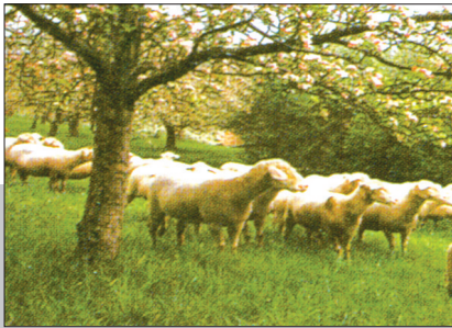
▲我市依托丰富的牧草资源,大力发展良种食草富禽,全市存栏量达230多万只(头)。