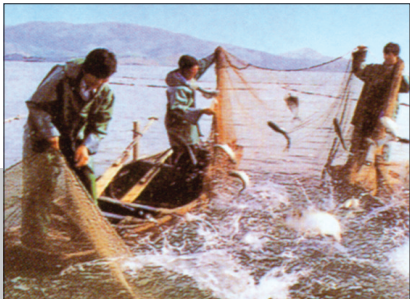
▲12万亩河蟹、青虾等特种水产养殖鼓起了农民的腰包,也让城里人大饱口福。