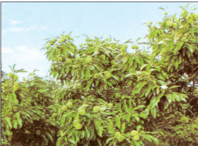
▲南北两山开发初具规模,10万亩板栗挂果累累,成为农民增收的一大亮点。