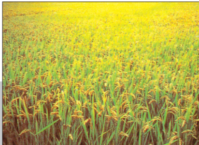
▲62.34万亩水稻虽然遭受了褐飞虱等病虫害,但由于防治得力,仍有望丰收。