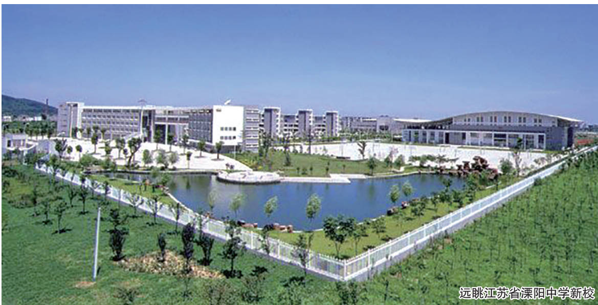
远眺江苏省溧阳中学新校