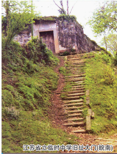
江苏省立临时中学旧址大门(皖南)