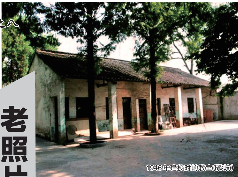
1946年建校时的教室(歌岐)