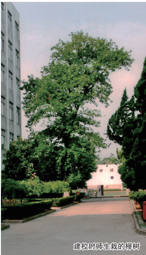
建校时师生栽的榉树