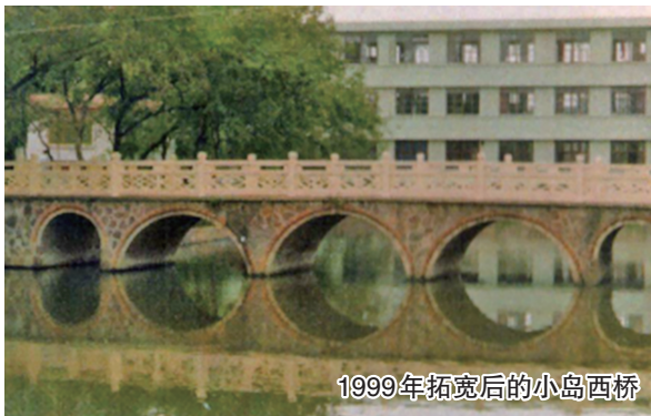
1999年拓宽后的小岛西桥