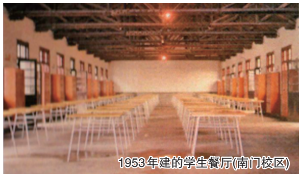
1953年建的学生餐厅(南门校区)