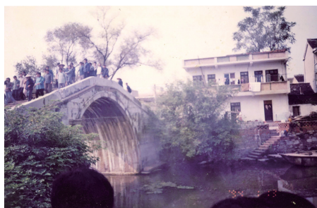
1998年,电视剧《农民陈奂生》观莲桥取景