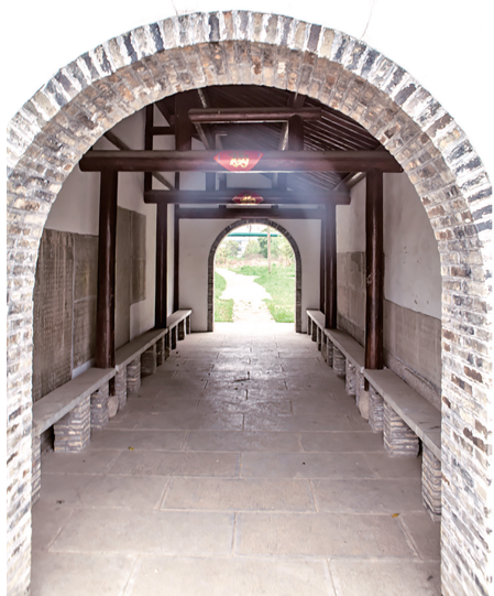
观莲桥南的凉亭(又叫歇脚茶亭)