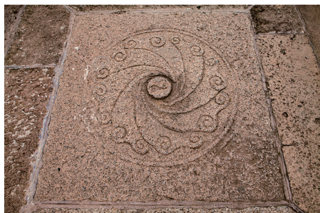
观莲桥上的龙门石