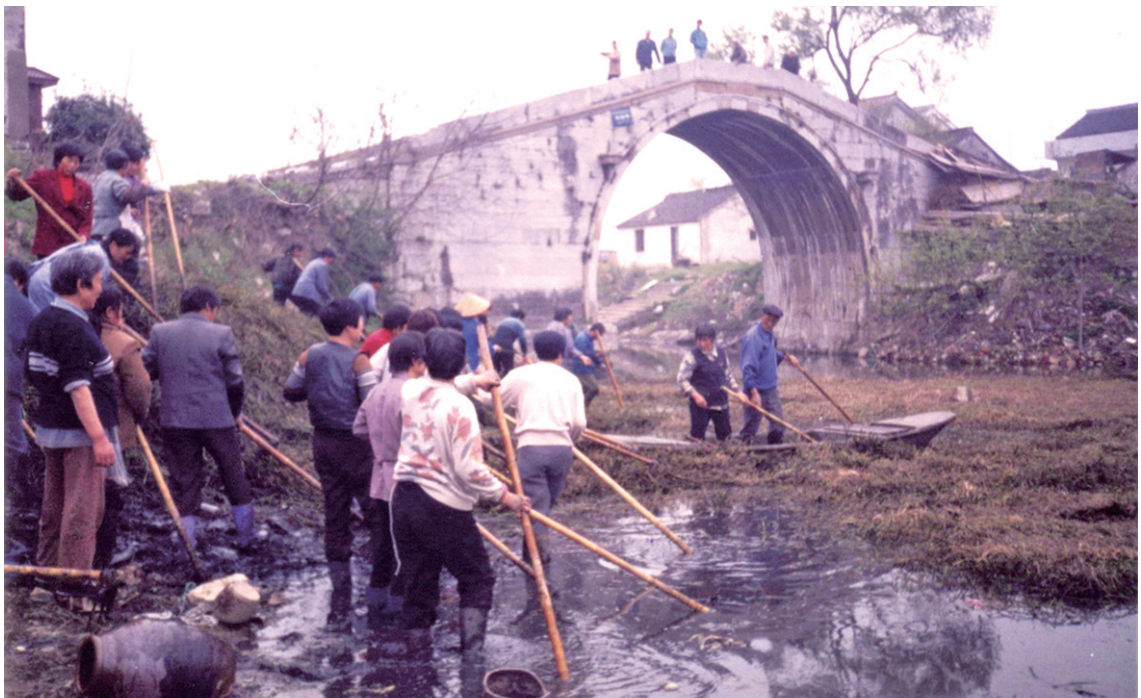
2004年3月,昆仑村村民自发组织清理观莲桥下水中的淤泥