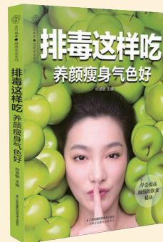
排毒这样吃 ——养颜瘦身气色好

在这个鸿雁传书已成过去时的即时通讯年代，被印刻在泛黄书信上的一字一句显得弥足珍贵。纸短情长，朱生豪用他短暂的人生，诠释了一生只够爱一个宋清如的深情和浪漫。