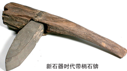
新石器时代带柄石铤

带柄石铤1978年5月出土于溧阳古沙河故道中，系国家一级文物。器物通长32厘米，宽18.5厘米，高6.2厘米，由石铤与木柄两部分组成。石铤为有段石铤，正面呈长方形，背面上部有段，通体磨制光滑，棱角齐整，刃口有使用的崩裂痕迹。木柄保存较好，头部粗大，握手处变细作扁圆形。出土时石铤段部正好卡住木柄的卯口，先民以石铤的顶部装入木柄头部凿有的卯口内，运用榫卯方式安柄使用。南京大学地理系碳14实验室曾对相关木器标本进行检测，测定年代为距今4433±111年，大致相当良渚文化晚期（见肖