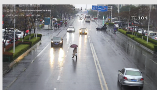
罗湾路时代景城路段