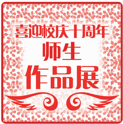
(Logo 设计:美术学院 许 赛)

2006 年夏天,南师泰州学院图书馆招聘首批工作人员,我有幸被录用,这一年我走进了学院。