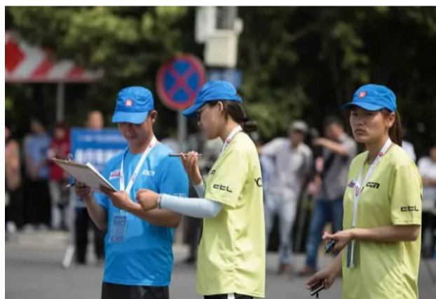
体教在赛事中担任裁判