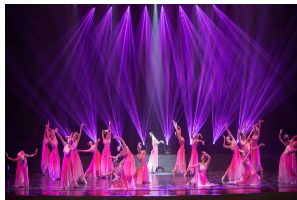
音乐学院舞蹈表演