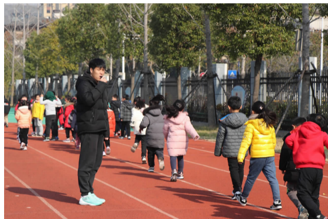
体育师范进行教育实习