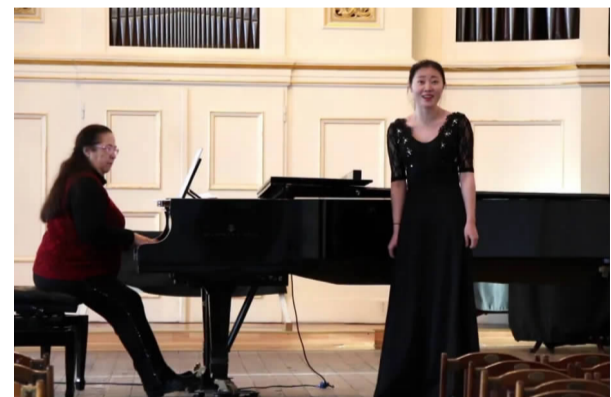
音乐专业汇报演出