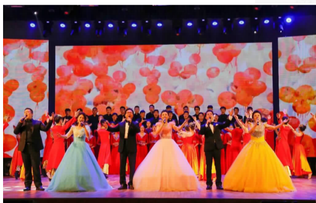
音乐学院“文雅艺术进校园”