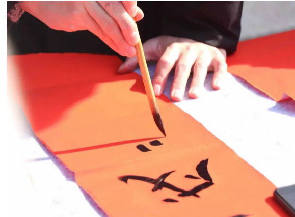
书法专业现场题字