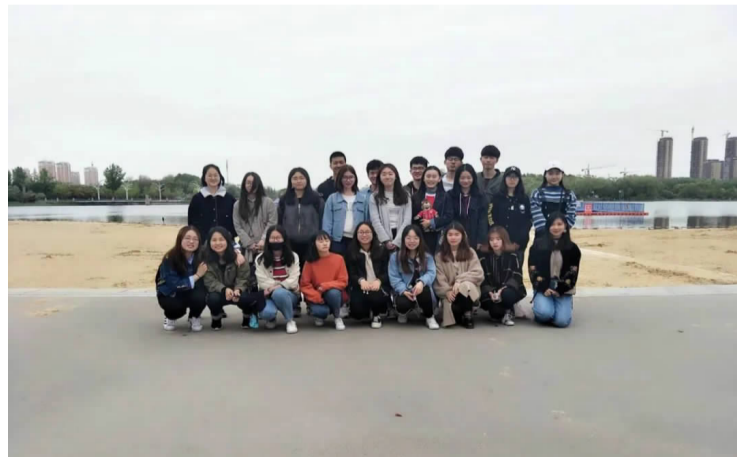
外国语学院英语师范 1706 班

教师教育学院小学教育 1702 班以“抓学风、塑班风”为理念,被评为 2018-2019 年度南京师范大学泰州学院“先进班级”、2019 年五四“特色团支部”。班级始终将思想政治工作视为重点,全班 61 名同学全部递交了入党申请书,现有 21 人参加了校中级党校学习,正式党员 1 名,预备党员 4 名。班级坚持以促学业为核心,营造你追我赶的学习氛围,1 人获得 2019 年“院长奖学金”,累计 33 人获得滚动奖学金,大学英语四六级、计算机等级考试通过率均达 90% 以上。多名同学积极参加大学生创新创业训练计划项目。班级同学热爱公益,积极投身社会实践活动,暑期社会实践参与率 100%,90% 的同学加入了教师院的“四点课堂”等志愿服务项目。2019 年班级成员参加“萤火之行”暑期公益支教团队,获“全国百强暑期社会实践团队”“团中央千校千项优秀案例”等四项国家级表彰。2020 年疫情期间,两位同学参与社区防疫工作,多位同学参加了“停课不停学”志愿服务活动,该活动收获了中国青年网、泰州教育发布等多家媒体报道。