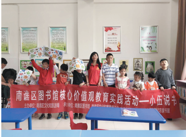
近日,南谯区图书馆举办了一场核心价值观教育实践——“小伍说书”活动,让孩子们在欣赏中国传统艺术形式“评书”的过程中,了解滁州本地的历史文化,引发孩子们对家乡的爱之情。