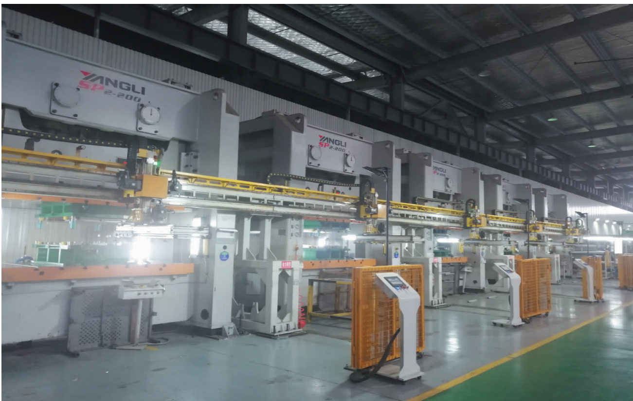
企业自动化生产车间