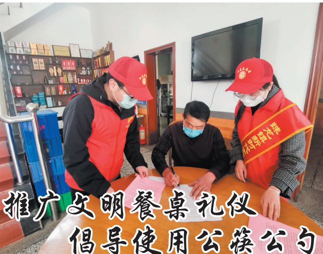
推广文明餐桌礼仪 倡导使用公筷公勺

该镇确定三月份为全民阅读学习1个月,建立农家书屋工作群,工作人员每天向3户农户上门送3本书,送书前由读者选择好图书目录。工作人员与读者送书交流时,都要戴好口罩;全民阅读学习月结束后,工作人员向包保的90名读者每人提出3个与阅读图书内容有关的问题,巩固读书成果。(沙扣年)