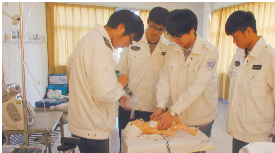
院前急救专业学生正在学习儿童急症的规范操作。

“然而在教学中,我们觉得中国的儿童院前急救教学培训还有很多需要规范的地方。”秦啸龙说,比如一名孩子吃零食时突然呛到剧烈咳嗽,其母亲忙着给孩子拍后背,但孩子的情况看上去却更加糟糕了。“你是一名院前急救医生,报警到达时现场一片混乱,妈妈正紧紧抱着孩子哭泣……这时候应该如何规范操作?先做什么后做什么?”秦啸龙介绍,一般发生这类情况,急救医生可能会根据自己的经验进行处置,而这些处置是否及时、正确和有效,将直接影响病孩的健康及生命。等患儿到了医院,还时常会因为院内医生与院前急救医生操作规范不统一,交接患儿过程中对病情内容的侧重不一致、判断表达不统一等问题,给患儿做重复的检查,不仅