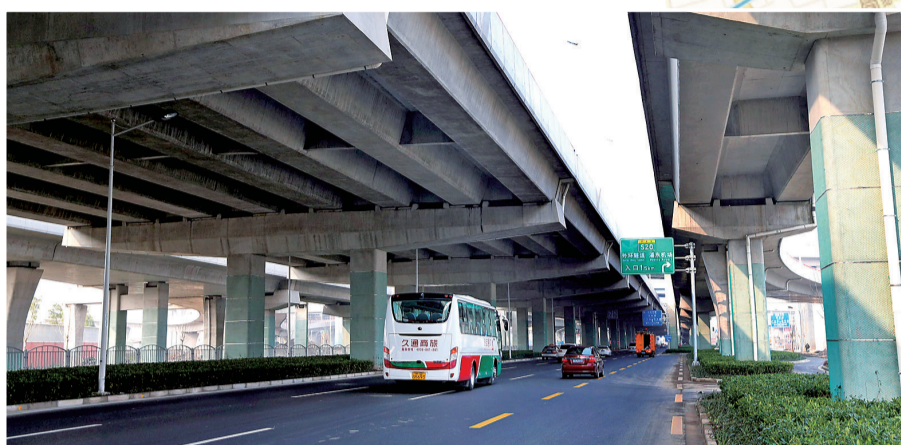
中环线浦东段全部开通后有效缓解周边交通压力。