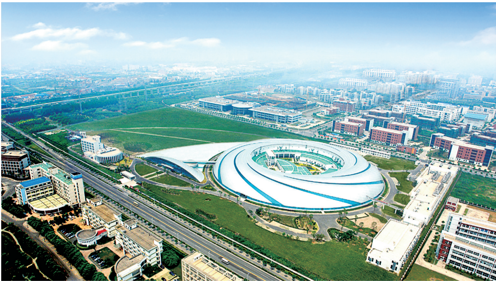
行动方案把配合推进一批大科学设施放在了首位。图为“上海光源”。

作为投贷联动基金的出资方之一,嘉兴汇美相关负责人表示,浦东想要打造科技创新中心核心功能区,必须推动一批知识密集型、专利创新型产业集团,打造一批具有核心技术和国际竞争力的知识产权创新企业,增信增贷计划不仅是一个打分系统,更是一种思维模式的创新,从而助推全区、全市营造更浓厚的创新氛围。