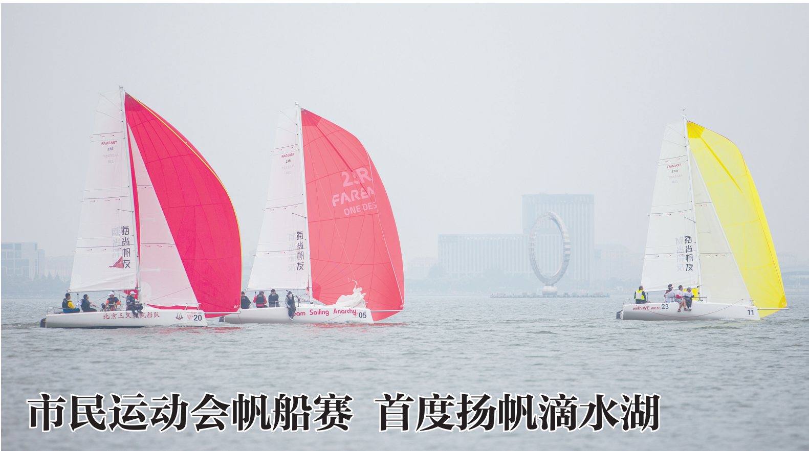
图为参赛帆船在滴水湖上展开较量。

记者了解到,目前市、区有关方面正按照“谁审批、谁监管;谁主管、谁监管”以及“属地监管”的原则和要求,对116个改革事项,按不同行业的要求,逐项制定事中事后监管方案和实施细则,并有望近期推出实行。与此同时,《中国(上海)自由贸易试验区和浦东新区事中事后监管体系的总体方案》也在研究制定中。