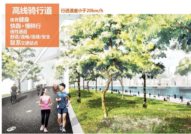
◀黄浦江东岸贯通整体方案示意图。 ▲规划中提及的高线骑行道效果图。 ▼规划中滨水到腹地,速度逐步提升。