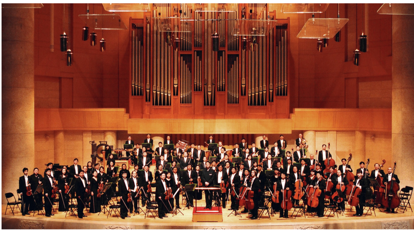
北京交响乐团

在北京众多交响乐团中,隶属于北京市文化局的市属乐团北京交响乐团,算得上是一个有点格格不入的“异数”和“清流”。在乐团艺术总监兼首席指挥谭