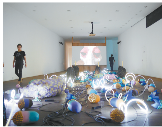
在装置作品《秘密花园》中,动画中的粘土兔子成为现场总指挥。