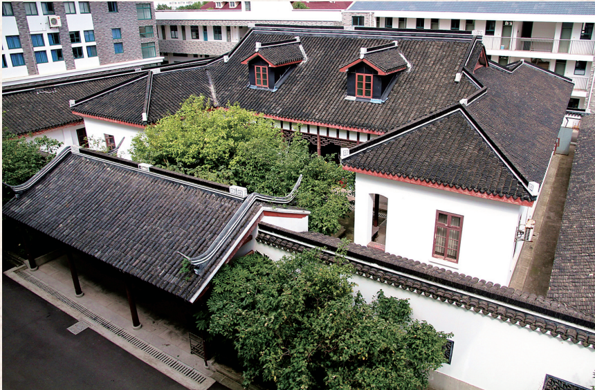
浦东中学杨斯盛故居