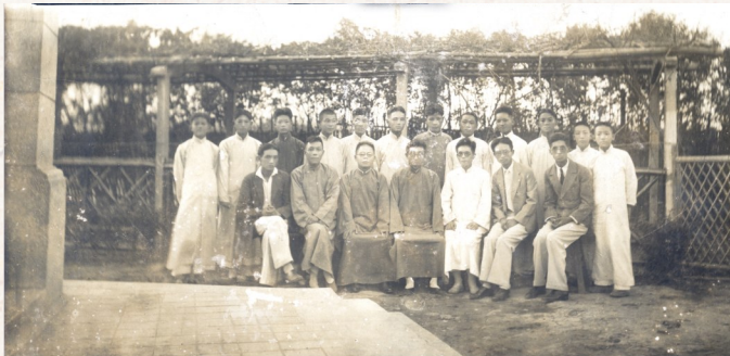
浦东最早的市立中学——洋泾中学首届(1933届)学生的毕业照,拍摄于震修小学(今浦东新区第二中心小学)杨家渡原址。