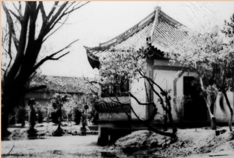
高桥小学和高桥中学先后使用过的岛亭教室,目前正在申报上海市优秀历史建筑。

在百年名校浦东新区第二中心小学的前身——杨家渡畔震修小学堂的校园里,1930年曾衍生出浦东最早的市立中学洋泾中学。1946年抗战胜利后,洋泾中学又在洋泾古镇接管私立洋泾中小学,纳为分校,解放后该分校独立发展为又一所浦东名校——建平中学。