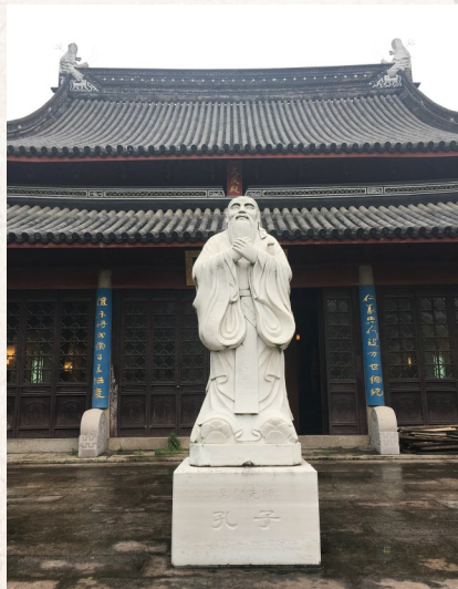
南汇孔庙——惠南小学和南汇中学先后从这里发源。