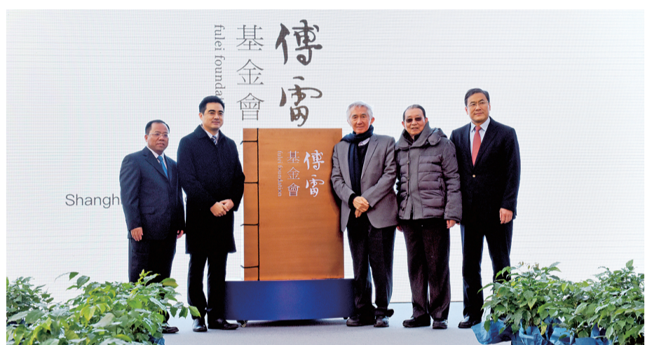
文化周浦将引领“六个周浦”建设。

未来五年，周浦将抓好精神文明建设，提升文化软实力，丰富周浦的文化气质和精神内涵。文化周浦将作为“六个周浦”建设的重点，引领周浦的发展。 讲好“周浦故事”。进一步打响傅雷文化品牌，设立傅雷文化基金会，拟建傅雷文化纪念场所等项目，建立傅雷教育体系，培育傅雷资源品牌。开展好各类节庆文化活动，以中华经典诵读等活动为载体，发挥文化育人的作用。依托“小上海故事会创作基地”，讲我们身边的凡人好事。大力推广公民道德实践活动，加强未成年人思想道德建设，拓展未成年人社会实践平台。 绘就“周浦形象”。建立区镇联动信息共享机制，力争使“周浦发布”成为全区街镇新媒体中的佼佼者。继续发挥《小上海·周浦》报贴近基层、群众的优势，努力成为镇党委政府宣传的主阵地、社会正能量传播的主渠道。 构建“周浦文脉”。实施周浦公园整体改建，将其打造成为多功能艺术文化主题公园。分类打造创客城、小微企业众创空间、创客村三大“众创空间”。开展“周浦文化嘉年华”系列文化活动，以非遗文化巡回展示、名人文化专题讲座等为主体，重点推进周浦民乐队、浦东宣卷和油画棒创作等群众文化品牌项目。启动建设非物质文化遗产展示中心。 “产业强” >> 提升经济质量和效益 未来五年，周浦镇将把握“互联网+”和“四新经济”发展趋势，推进产业结构调整，坚持走轻资产、高成长性、高技术含量、高附加值的产业发展道路，着力提升经济质量和效益。 创新园区管理体制机制，设立政府扶持基金，采取市场化运作手段推动园区产业转型升级。与临港集团开展战略合作，建设临港周浦新兴科技产业园项目，重点承接