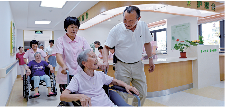
周浦敬老院的老人得到悉心照料。